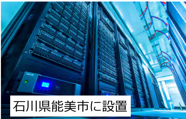
石川県能美市に設置